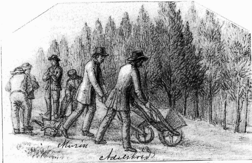
Den första rallarkärran. Ur Adelskölds skissbok.